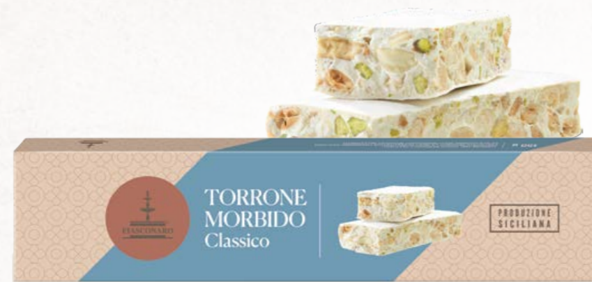
301014 CLASSICO 150 g