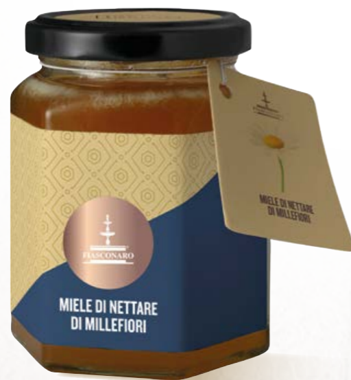
305002 MILLEFIORI 350 g