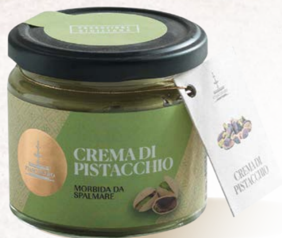
304010 CREMA DI PISTACCHIO 180 g