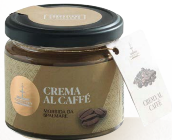
304012 CREMA AL CAFFÈ 180 g