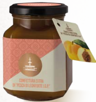
304006 "PESCA DI LEONFORTE I.G.P." 360 g