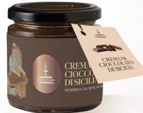
304018 CREMA DI CIOCCOLATO DI SICILIA 180 g