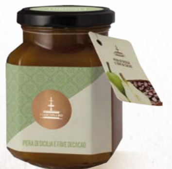
304029 PERA DI SICILIA E FAVE DI CACAO 360 g