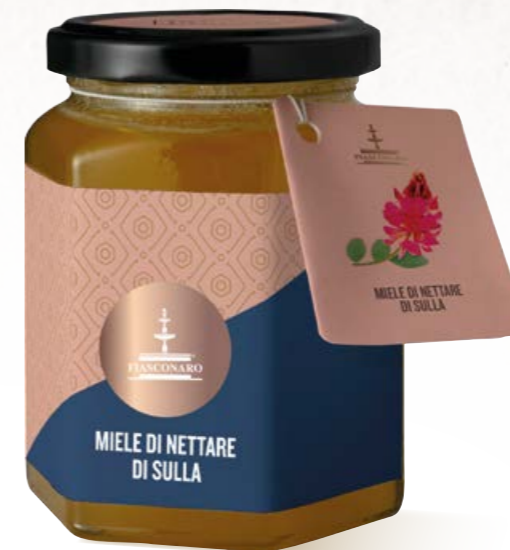
305004 SULLA 350 g