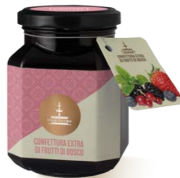
304007 FRUTTI DI BOSCO 360 g