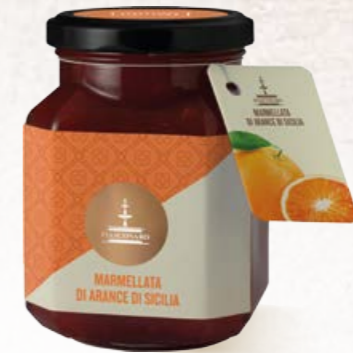
304003 ARANCE DI SICILIA 360 g