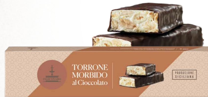
301012 CIOCCOLATO FONDENTE 150 g