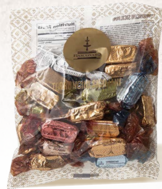
301001 BUSTA 250 g