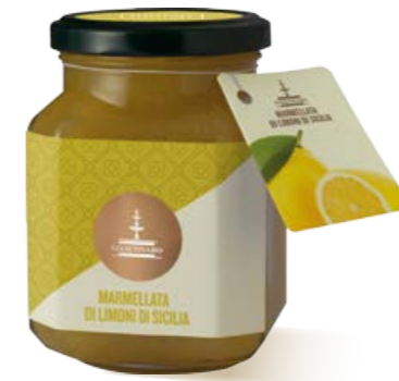
304004 LIMONI DI SICILIA 360 g