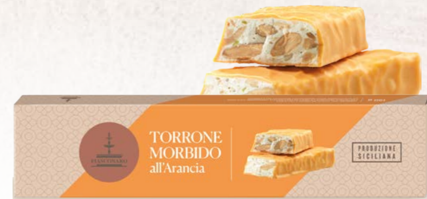
301011 ARANCIA 150 g