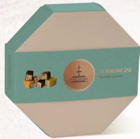
301046 CONFEZIONE OTTAGONALE 250 g