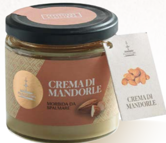
304011 CREMA DI MANDORLE 180 g