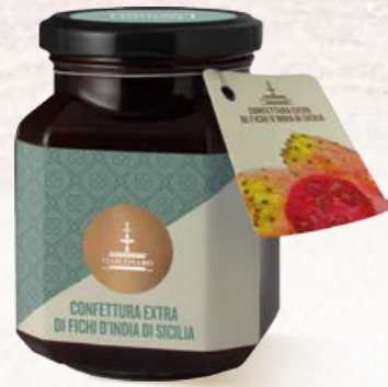
304001 FICHI D'INDIA DI SICILIA 360 g