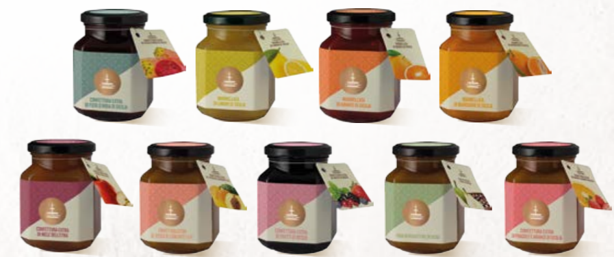
304032 PACCO MIX CONFETTURE 4320 g