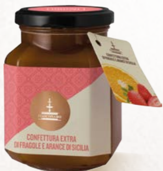
304030 FRAGOLE E ARANCE DI SICILIA 360 g