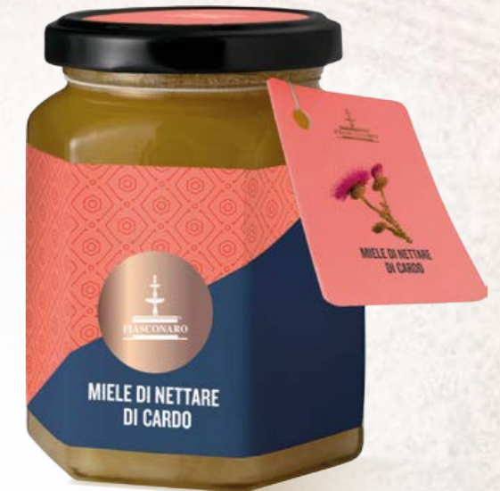
305007 CARDO 350 g