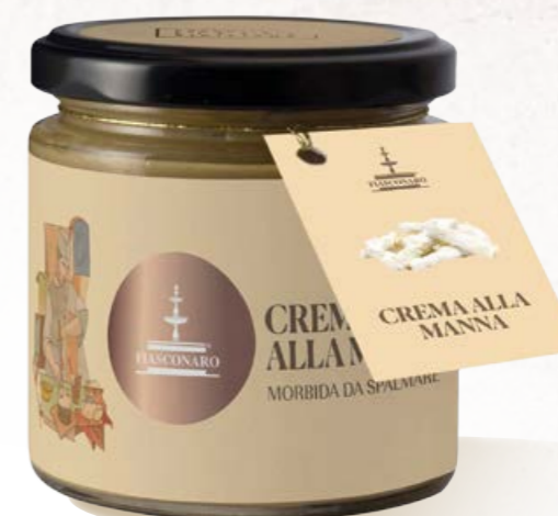
304013 CREMA ALLA MANNA 180 g