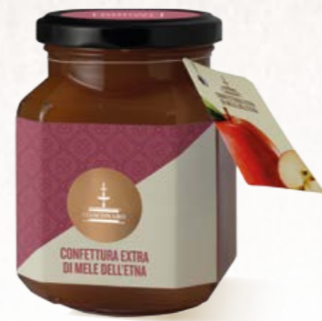
304002 MELE DELL'ETNA 360 g