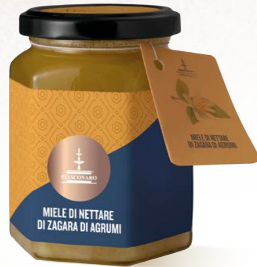
305001 ZAGARA DI AGRUMI 350 g