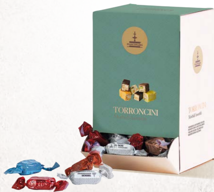
301048 TORRONCINI DA BANCO 1500 g