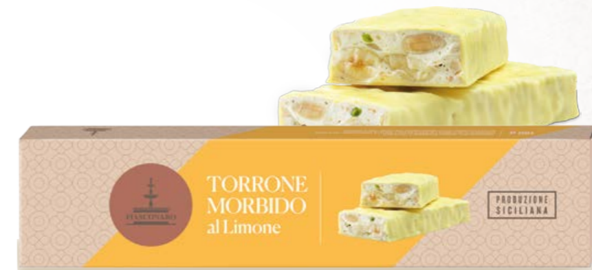
301010 LIMONE 150 g