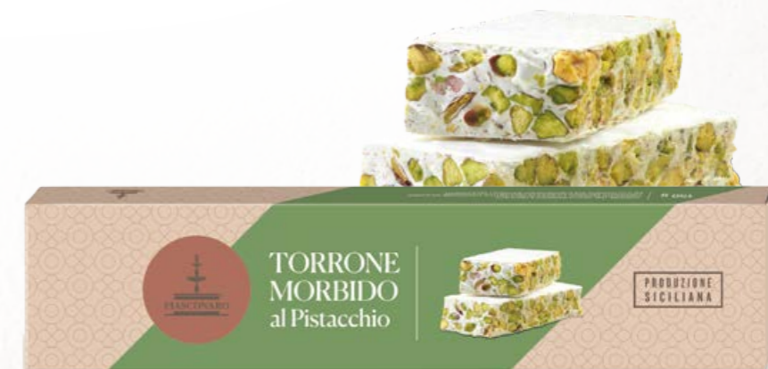
301031 PISTACCHIO 150 g