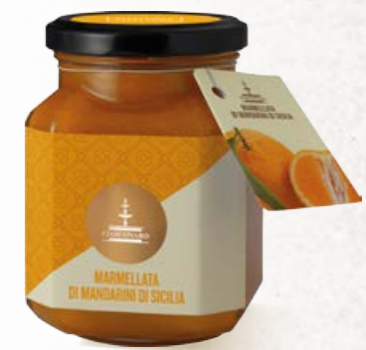
304005 MANDARINI DI SICILIA 360 g