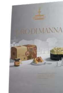
CARTELLI VETRINA ORO DI MANNA NATALE