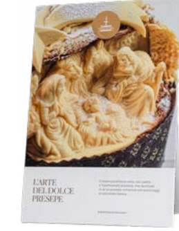
CARTELLI VETRINA DOLCE PRESEPE NATALE