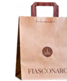
SHOPPER 500-750 G