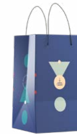
SHOPPER LINEA 100 G NATALE