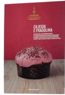
CARTELLI VETRINA CILIEGIA E FRAGOLINA NATALE