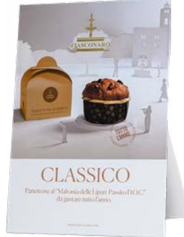
CARTELLI VETRINA CLASSICO 500 G NATALE