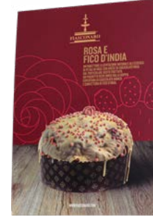
CARTELLI VETRINA ROSA E FICO D'INDIA NATALE