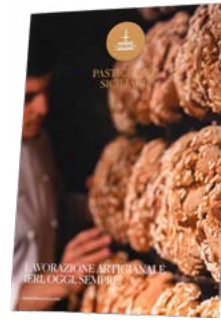
CARTELLI VETRINA BRAND NATALE