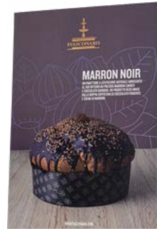
CARTELLI VETRINA MARRONI E GIANDUIA NATALE