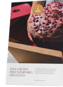
CARTELLI VETRINA LINEA SPECIALITÀ NATALE