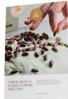
CARTELLI VETRINA LINEA ORO NATALE