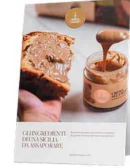
CARTELLI VETRINA LINEA TERRITORIALE NATALE