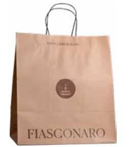
SHOPPER 1 KG