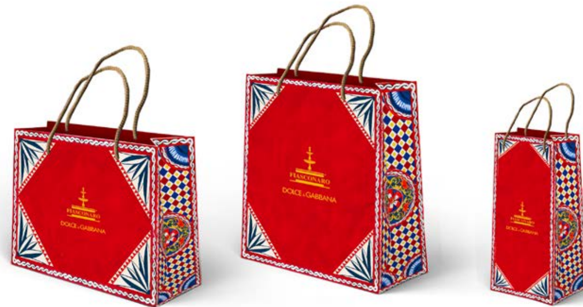
SHOPPING BAG TORRONCINI