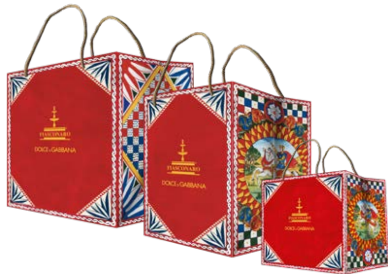
SHOPPING BAG PANETTONI E CREME SHOPPING BAG PANETTONI AND CREAMS

EACH PRODUCT IN THE COLLECTION WILL BE ACCOMPANIED BY A SHOPPING BAG AND AN EMOTIONAL LEAFLET.